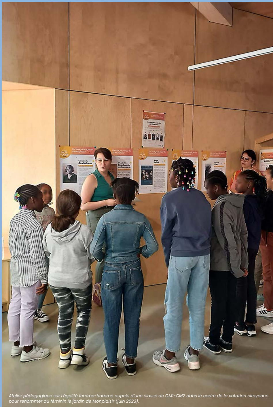
Atelier pédagogique sur l'égalité femme-homme auprès d'une classe de CM1-CM2 dans le cadre de la votation citoyenne pour renommer au féminin le jardin de Monplaisir (juin 2023).